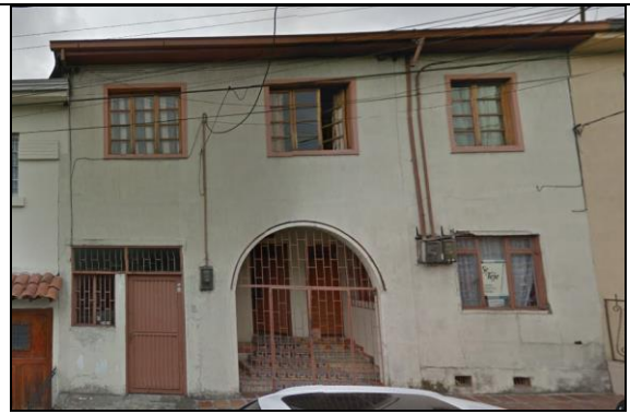
Fotografía 2. Edificación a demoler para desarrollar el proyecto.