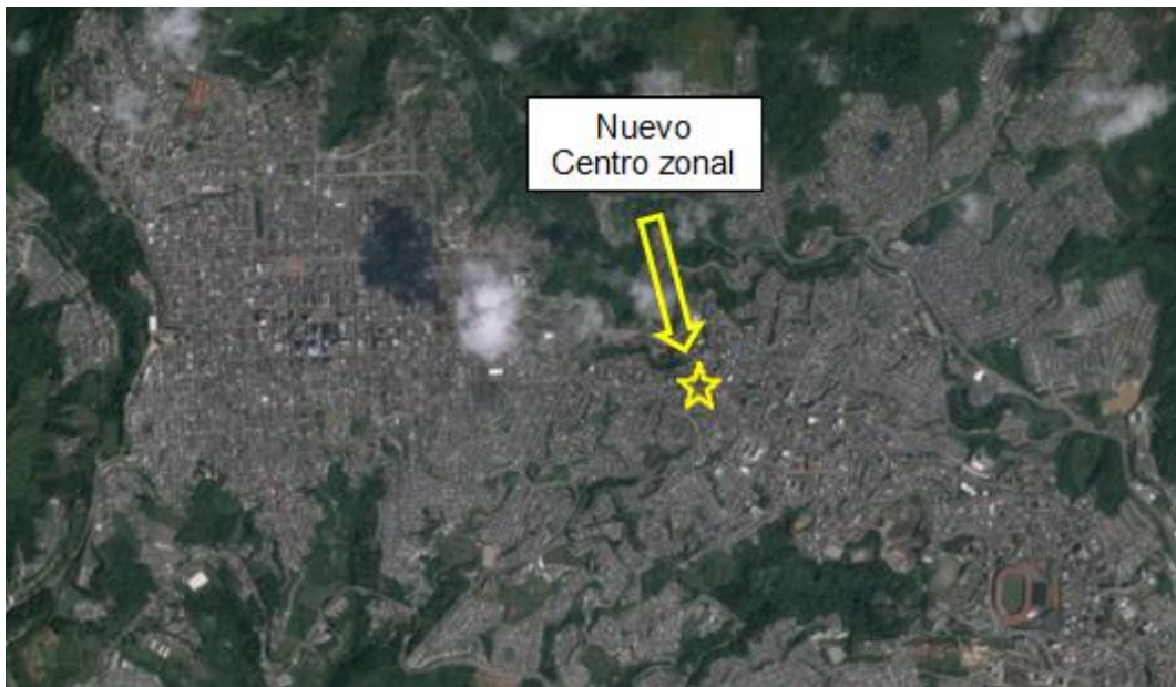
Esquema 1 Localización del proyecto para la construcción del C.Z.