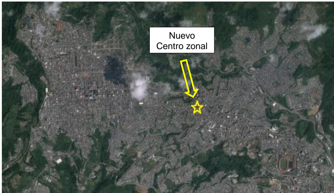
Esquema 1 Localización del proyecto para la construcción del C.Z.

Ubicación del Lote: El lote en el cual se desarrollará el proyecto corresponde al predio con cod catastral: 17001010301470009000 y matricula inmobiliaria N° 100-14599 de propiedad del INSTITUTO COLOMBIANO DE BIENESTAR FAMILIAR – ICBF, con un área aproximada de 205 m2.