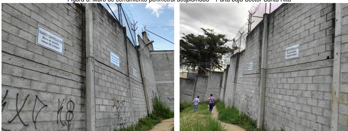
Figura 6. Tramos de muro de cerramiento perimetral desplomados.