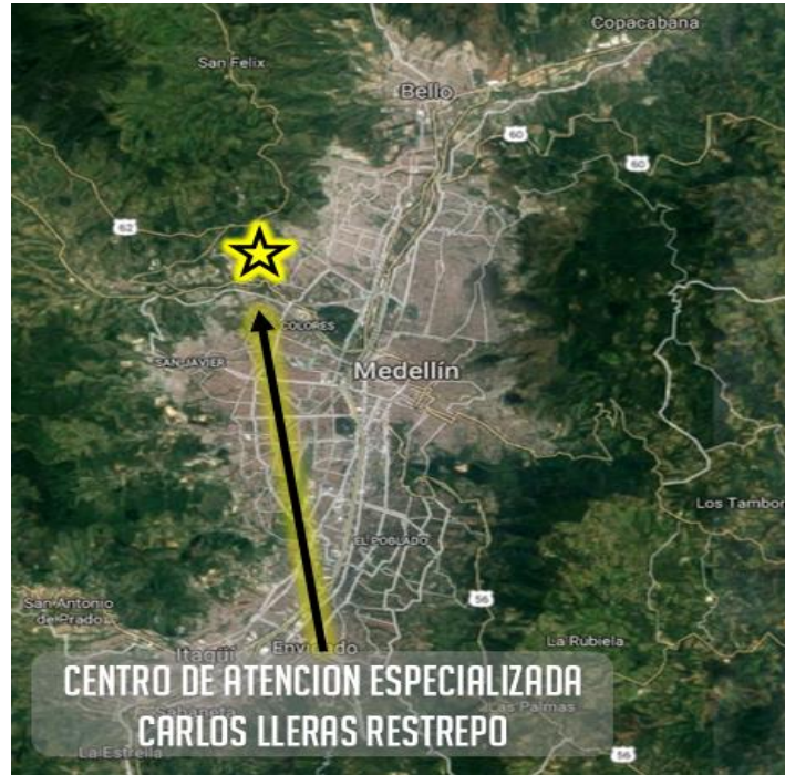
Figura 1. Localización Centro de Atención Especializado Carlos Lleras Restrepo – Medellín