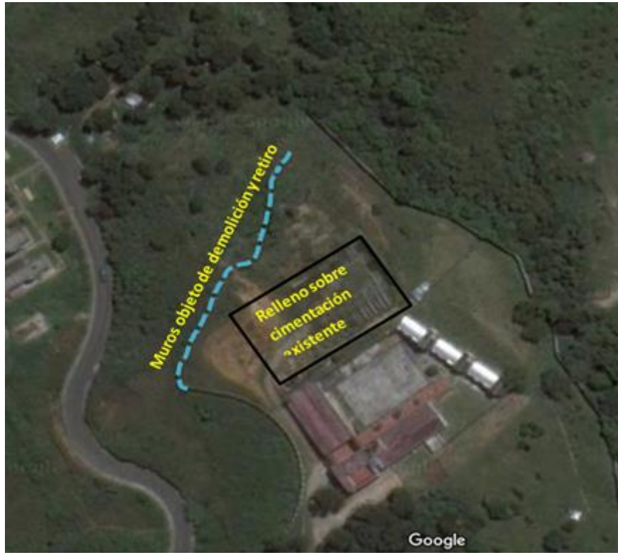
Figura 3. Esquema general de las actividades a desarrollar.