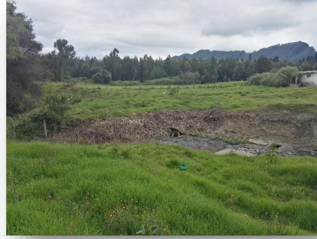
Area para implantación del Sistema de Tratamiento