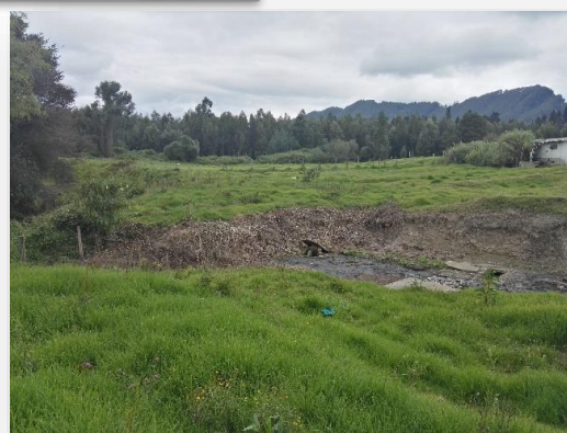
Area para implantación del Sistema de Tratamiento