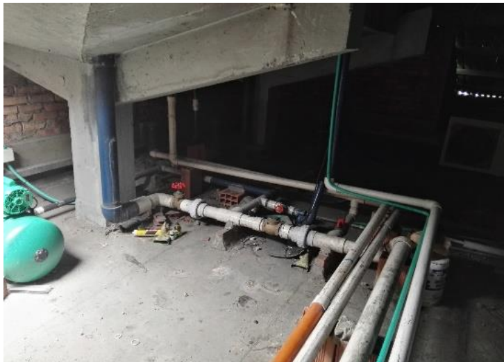
Sistema tuberías tanque aéreo