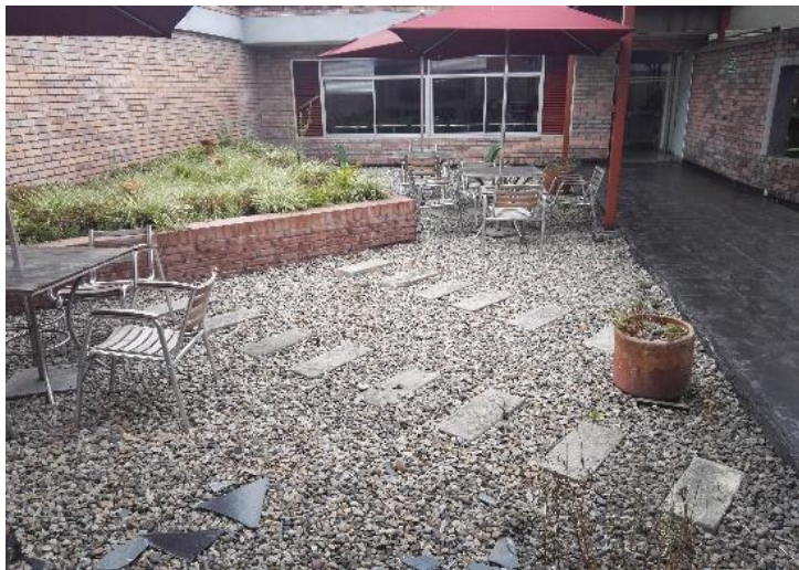
Terraza de “La Torre”