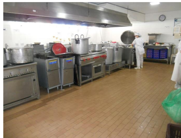
Vista general cocina Sede San Francisco

“Se propone entre FINDETER e ICBF adelantar un proyecto nuevo que contemple el diseño y la construcción de la cocina San Francisco, de tal forma que se puedan intervenir otros espacios y garantizar que la obra consiga la condición “FAVORABLE” por parte de la Secretaría de Salud. Esto en el marco del Contrato Interadministrativo No. 1564 de 2016, que cuenta con disponibilidad de recursos. En consecuencia se solicita a FINDETER que adelante las gestiones pertinentes”.