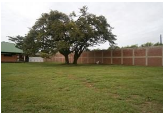
Área del proyecto en donde se ubicara el sistema integrado