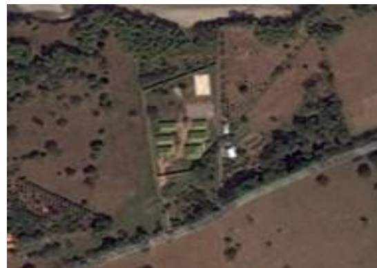
Foto aerea del lote, con área aproximada de 28.882,09 m 2