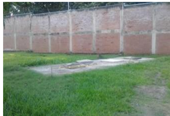
Pozo séptico existente, el cual se deberá dejar sellado y desconectado