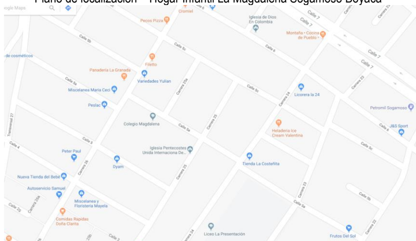
Plano de localización – Hogar Infantil La Magdalena Sogamoso Boyacá