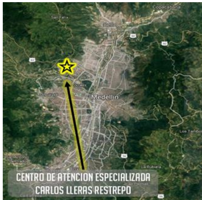
Figura 1. Localización Centro de Atención Especializado Carlos Lleras Restrepo – Medellín