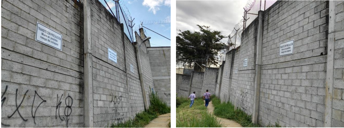
Figura 6. Tramos de muro de cerramiento perimetral desplomados.