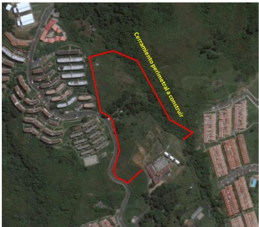
Figura 4. Muros de cerramiento perimetrales – Parte alta Sector Pola III.