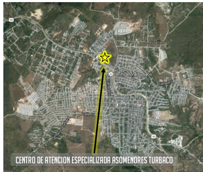
Figura 1. Localización Centro de Atención especializada Asomenores – Turbaco

Adicionalmente el seguimiento y control a la Interventoría por parte de LA CONTRATANTE y/o el supervisor designado será realizado en la ciudad de Bogotá.