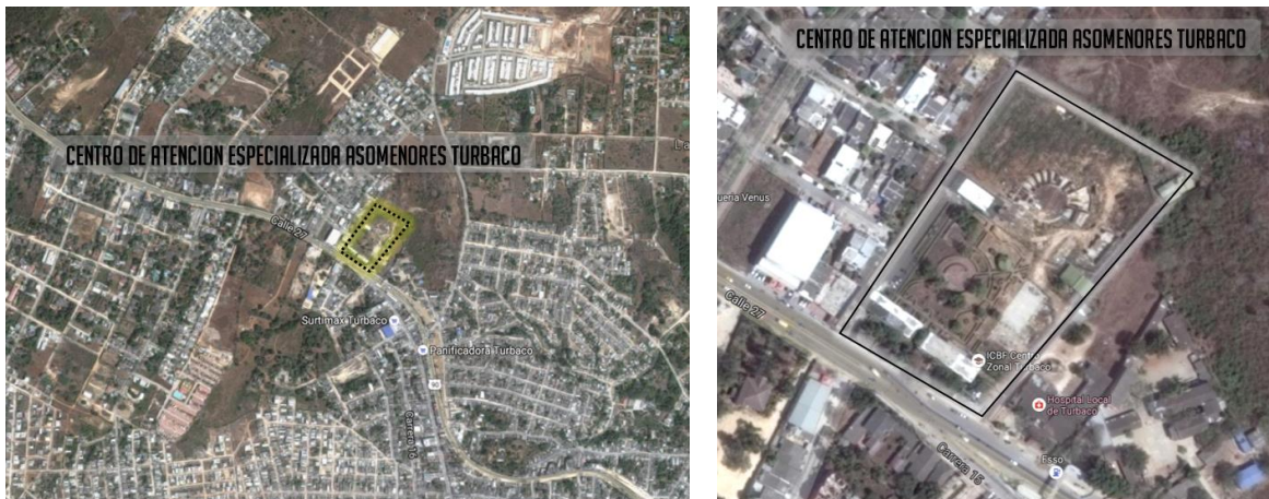
Figura 2. Localización Centro de Atención especializada Asomenores – Turbaco

El Centro de Formación Juvenil del Valle, de la Ciudad de Cali, Departamento del Valle del Cauca en el Callejón vía Comfenalco Carrera 108 No.48-91 en la ciudad de Cali. El Centro de Formación Valle de Lili, se encuentra ubicado en el municipio de Cali kilómetro 1 Vía a Jamundí, a unos 500 metros de la vía principal en zona de formación urbana