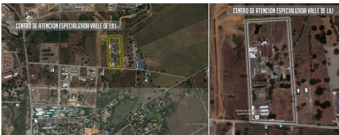
Figura 4. Localización Centro de Formación Juvenil de Valle de Lili Ciudad de Cali Departamento de Valle del Cauca