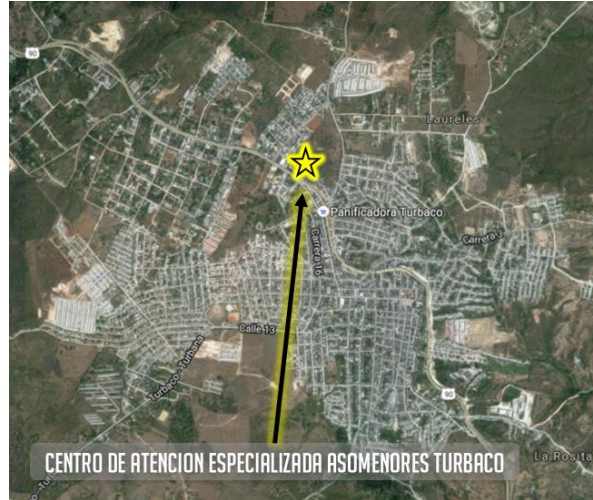
Figura 1. Localización Centro de Atención especializada Asomenores – Turbaco