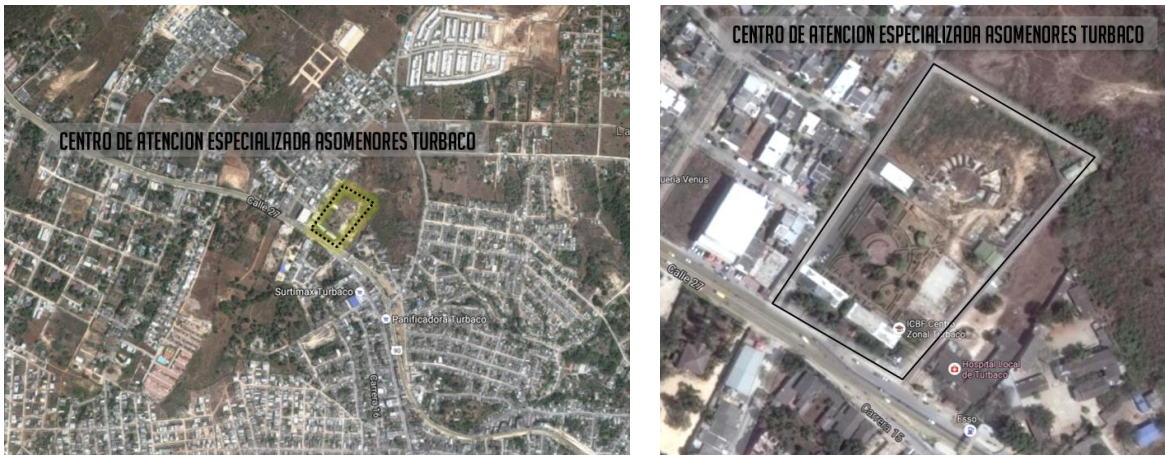
Figura 2. Localización Centro de Atención especializada Asomenores – Turbaco

El Centro de Formación Juvenil del Valle, de la Ciudad de Cali, Departamento del Valle del Cauca en el Callejón vía Comfenalco Carrera 108 No.48-91 en la ciudad de Cal. El Centro de Formación Valle de Lili, se encuentra ubicado en el municipio de Cali kilómetro 1 Vía a Jamundí, a unos 500 metros de la vía principal en zona de formación urbana