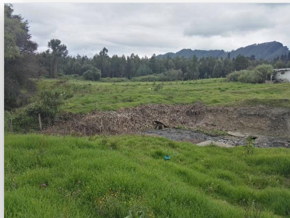
Area para implantación del Sistema de Tratamiento