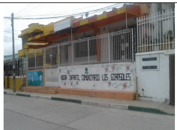
Fotografía 2. Edificación a demoler para desarrollar el proyecto.