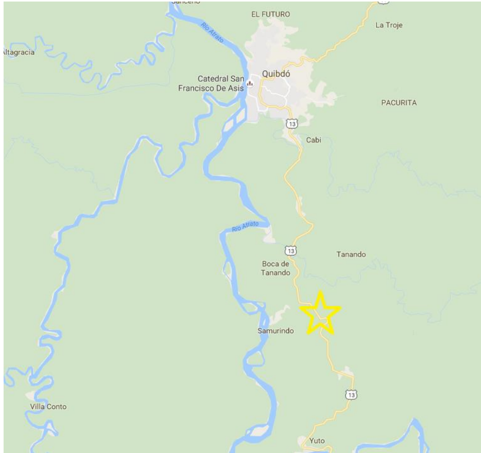
Figura 1. Localización CAE QUIBDÓ del departamento de Chocó.

Ubicación del Lote: El lote en el cual se desarrollará el proyecto corresponde al predio con matrícula inmobiliaria N° 180-180435 de propiedad del INSTITUTO COLOMBIANO DE BIENESTAR FAMILIAR – ICBF, con un área aproximada de 30.000 m2.