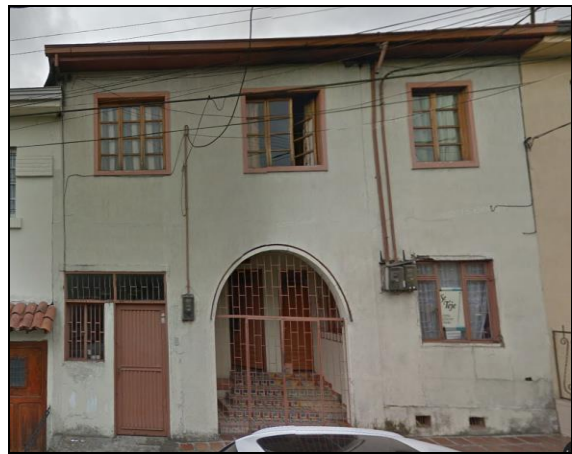
Fotografía 2. Edificación a demoler para desarrollar el proyecto.