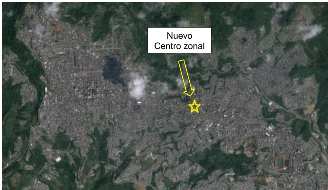
Esquema 1 Localización del proyecto para la construcción del C.Z.

Ubicación del Lote: El lote en el cual se desarrollará el proyecto corresponde al predio con COD CATASTRAL: 17001010301470009000 y matrícula inmobiliaria N° 100-14599 de propiedad del INSTITUTO COLOMBIANO DE BIENESTAR FAMILIAR – ICBF, con un área aproximada de 205 m 2 .