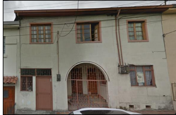
Fotografía 2. Edificación a demoler para desarrollar el proyecto.