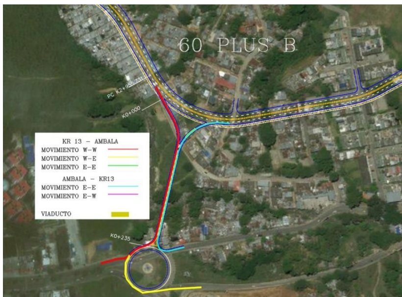
Figura No. 2. Esquema básico de la alternativa Calle 60 Plus B

De todas las alternativas de conexión planteadas se escogió por parte de la administración la alternativa Calle 60 Plus B