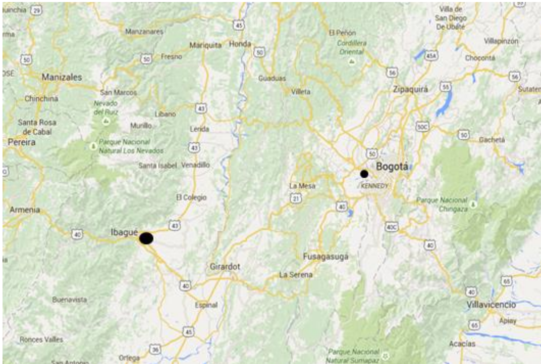
Figura No.1. Localización Municipio de Ibagué – Tolima.

La ubicación puntual dentro de la ciudad de Ibagué de la consultoría se relaciona a continuación: