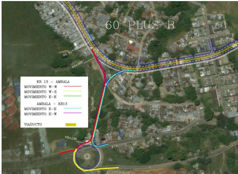
Figura No. 3. Render alternativa Calle 60 Plus B