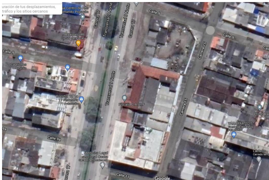
Fotografía 2. Localización General del Proyecto en la ciudad de Popayán.