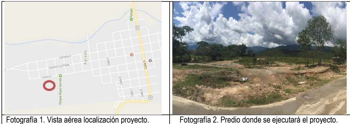
Fotografía 1. Vista aérea localización proyecto.

La ejecución de la infraestructura objeto de la presente convocatoria se llevará a cabo en el lote identificado bajo la Matrícula Inmobiliaria No. 202-70847 de la Oficina de instrumentos Públicos de El Agrado, propiedad del municipio de El Agrado con área de 11.078,46 m 2 , con un área de intervención de 3.000 m 2 .