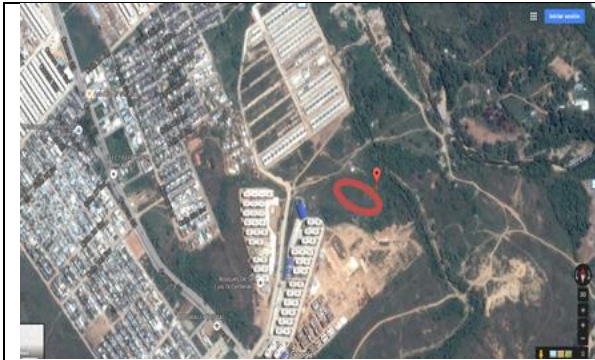
Fotografía 1. Vista aérea localización proyecto.

La ejecución de la infraestructura objeto de la presente convocatoria se llevará a cabo en el lote identificado bajo la Matrícula Inmobiliaria No. 200-232793 y 200-232795 de la Oficina de instrumentos Públicos de Neiva, con área de 8.310,37 m 2 , y con un área de intervención de 4.000 m 2 , propiedad del municipio de Neiva.