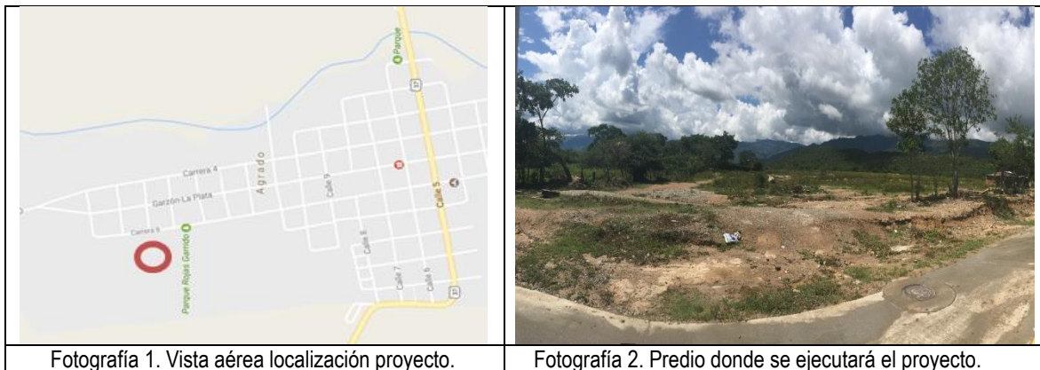
Fotografía 1. Vista aérea localización proyecto.

La ejecución de la infraestructura objeto de la presente convocatoria se llevará a cabo en el lote identificado bajo la Matrícula Inmobiliaria No. 202-70847 de la Oficina de instrumentos Públicos de El Agrado, propiedad del municipio de El Agrado con área de 11.078,46 m 2 , con un área de intervención de 3.000 m 2 .