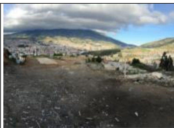
Fotografía 2. Vista del predio (Parte superior)