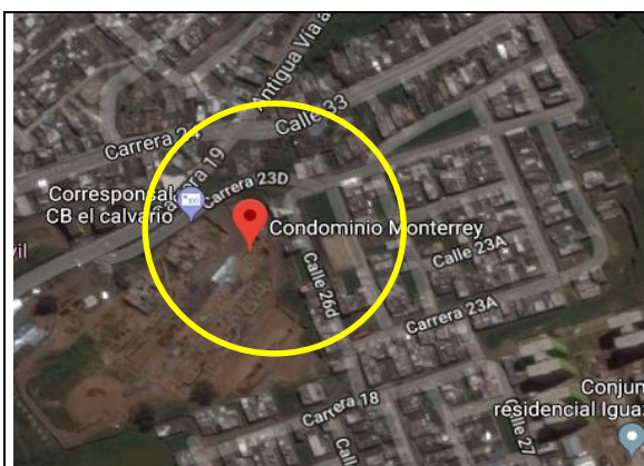
Fotografía 1. Localización proyecto.

La ejecución de la infraestructura objeto de la presente convocatoria se llevará a cabo en el lote identificado bajo la Matrícula Inmobiliaria No. 240-254286 de la Oficina de instrumentos Públicos de Pasto, con área total de 5.879.6 m 2 aproximadamente, propiedad del municipio de Pasto. Del área total del lote disponible solo se intervendrá un área de 3.240m 2 .