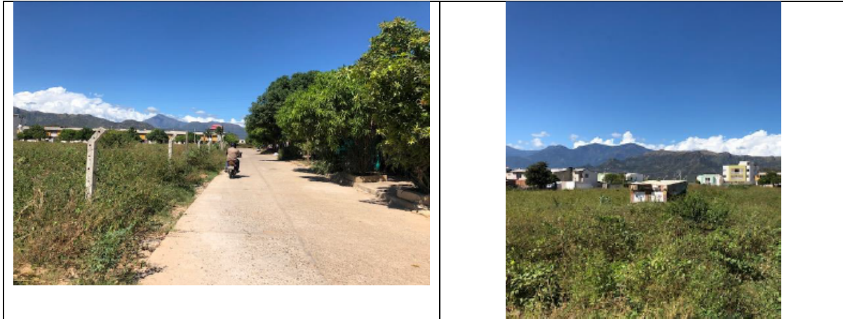
Fotografías. localización proyecto urbanización Tobías Daza - Valledupar