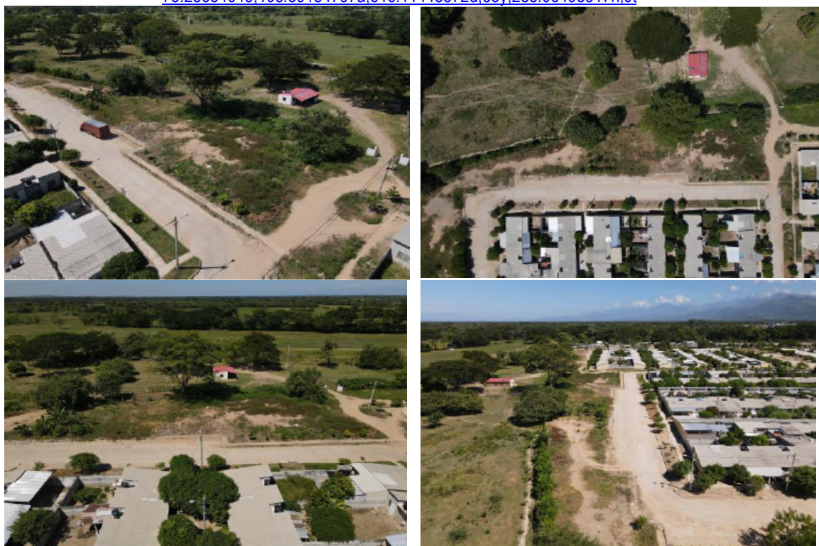
Fotografías. localización proyecto Urbanización los Manguitos – Becerril