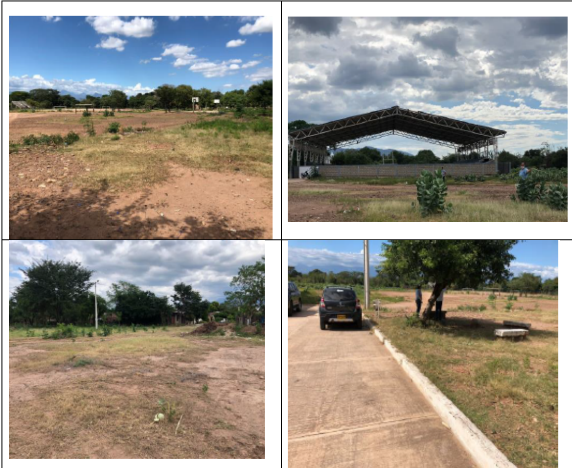
Fotografías. localización proyecto Urbanización San Felipe – San Diego