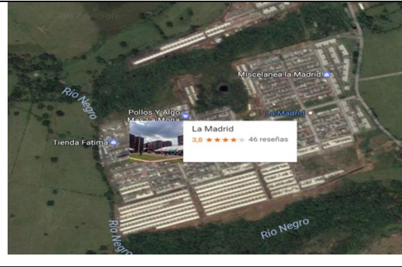
Fotografía 2. Predio donde se ejecutará el proyecto.

Ubicación del Lote: El lote en el cual se desarrollará el proyecto corresponde al predio con matrícula inmobiliaria No. 230-173637, de propiedad de la alcaldía Municipal de Villavicencio, con un área aproximada de 24.503,27 m2.