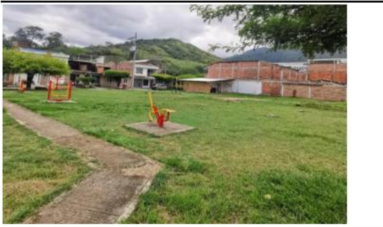
VISTA GENERAL AL INTERIOR DEL PREDIO