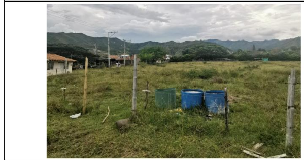
VISTA GENERAL COSTADO OCCIDENTAL DEL PREDIO POSTULADO