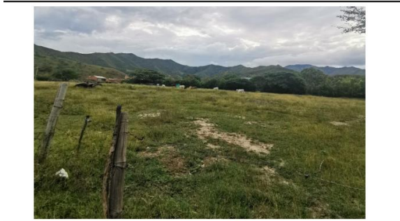
VISTA GENERAL AL INTERIOR DEL PREDIO