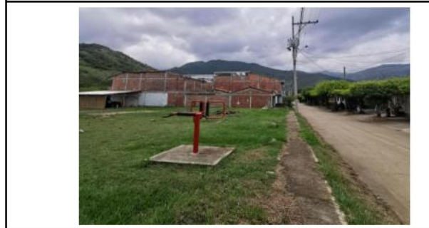
VISTA GENERAL COSTADO NORTE DEL PREDIO POSTULADO