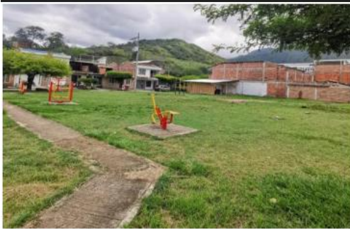
VISTA GENERAL AL INTERIOR DEL PREDIO