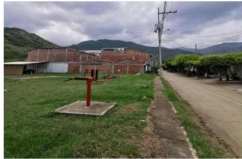
VISTA GENERAL COSTADO NORTE DEL PREDIO POSTULADO