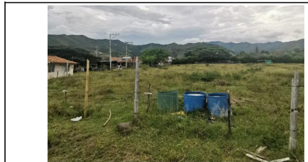
VISTA GENERAL COSTADO OCCIDENTAL DEL PREDIO POSTULADO