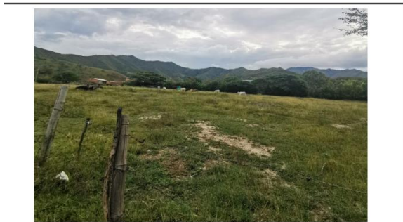
VISTA GENERAL AL INTERIOR DEL PREDIO