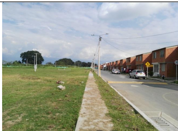
Fotografía 2. Predio donde se ejecutará el proyecto.

Ubicación del Lote: El lote en el cual se desarrollará el proyecto corresponde al predio con matrícula inmobiliaria No. 378-186982 de la Oficina de instrumentos Públicos de Candelaria, con área disponible de 7.985,30 m 2 propiedad del municipio de Candelaria.