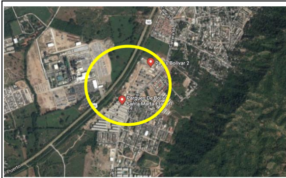
Fotografía 1. Vista aérea localización proyecto.