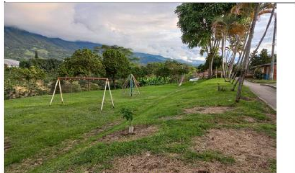
FOTOS DEL CONJUNTO RESIDENCIAL