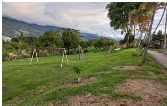
FOTOS DEL CONJUNTO RESIDENCIAL