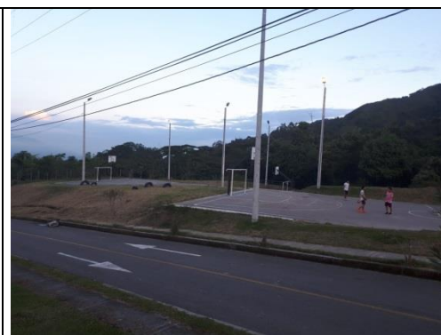
Fotografía 2. Vista del predio