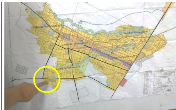
Fotografía 1. Localización proyecto.

La ejecución de la infraestructura objeto de la presente convocatoria se llevará a cabo en el lote identificado bajo la Matricula Inmobiliaria No. 196-59817 de la Oficina de instrumentos Públicos de Aguachica, con área total de 5.629 m 2 aproximadamente, propiedad del municipio de Aguachica. Del área total del lote disponible se intervendrá un área de 2.660 m 2 .