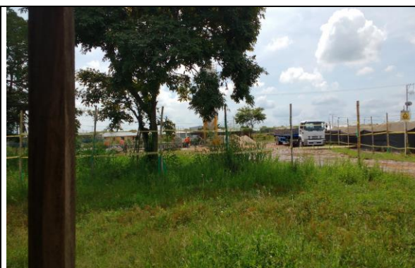
Fotografía 2. Vista del predio

Ubicación del Lote: El lote en el cual se desarrollará el proyecto corresponde al predio con matricula Inmobiliaria No. 196-59817 de la Oficina de instrumentos Públicos de Aguachica, con área total de 5.629 m 2 aproximadamente, propiedad del municipio de Aguachica.