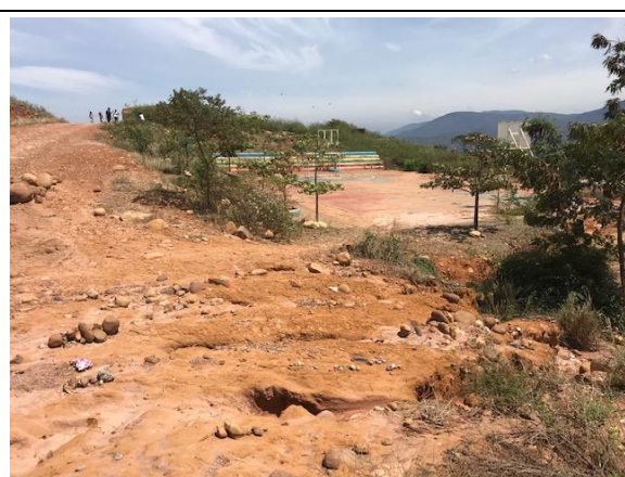
Fotografía 2. Vista general del predio urbanización Buenavista II

Ubicación del Lote: El lote en el cual se desarrollará el proyecto corresponde al predio con matrícula Inmobiliaria Matrícula Inmobiliaria No. N° 260-288793 de la Oficina de Instrumentos Públicos de Cúcuta, con área total de 3.927,42 m 2 aproximadamente, propiedad del municipio de Villa del Rosario