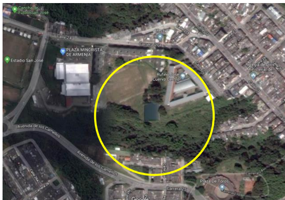
Fotografía 1. Vista aérea localización proyecto.

La ejecución de la infraestructura objeto de la presente convocatoria se llevará a cabo en el lote identificado bajo la Matrícula Inmobiliaria No. 280-217921 de la Oficina de instrumentos Públicos de Armenia, con área disponible de 2.258,00 m 2 propiedad del municipio de Armenia.