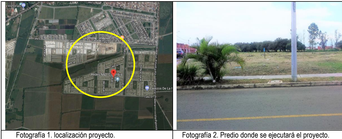
Fotografía 1. localización proyecto.

La ejecución de la infraestructura objeto de la presente convocatoria se llevará a cabo en el lote identificado bajo la Matrícula Inmobiliaria No. 378-209455 de la Oficina de instrumentos Públicos de Palmira, con área disponible de 4.235,119 m 2 aproximadamente propiedad del municipio de Palmira.