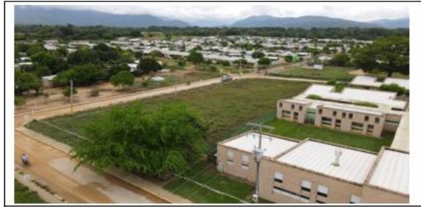
VISTAS AÉREAS GENERALES DEL LOTE PROPUESTO.