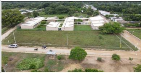
VISTAS AÉREAS GENERALES DEL LOTE PROPUESTO.