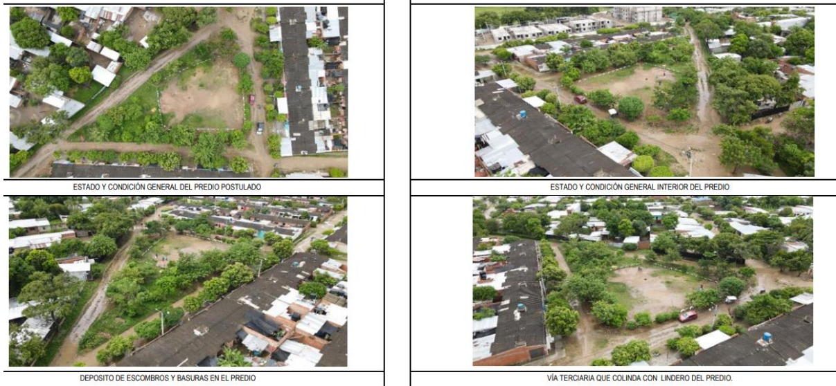
Fotografía 1. localización proyecto Urbanización Tierra Linda Aguachica Cesar