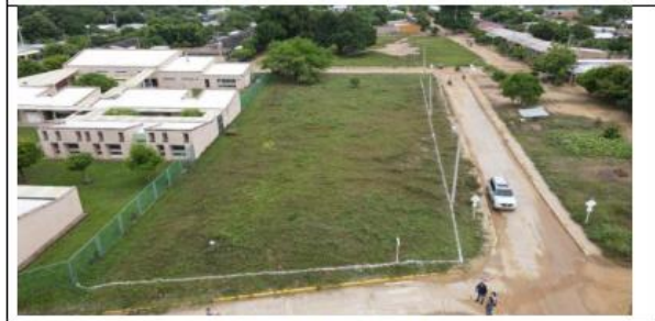
VISTAS AÉREAS GENERALES DEL LOTE PROPUESTO.