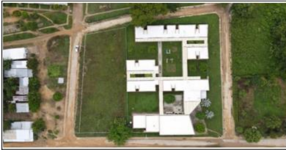
UBICACIÓN DEL LOTE DE EQUIPAMIENTO