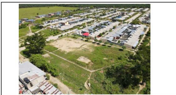
UBICACION DEL LOTE DE EQUIPAMIENTO