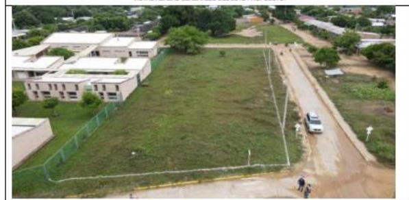
VISTAS AÉREAS GENERALES DEL LOTE PROPUESTO.