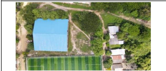
VISTA AÉREA GENERAL DEL PREDIO POSTULADO.