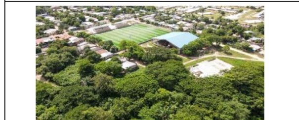
VISTA AÉREA GENERAL DEL PREDIO POSTULADO.