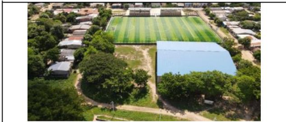
VISTA AÉREA GENERAL DEL PREDIO POSTULADO.