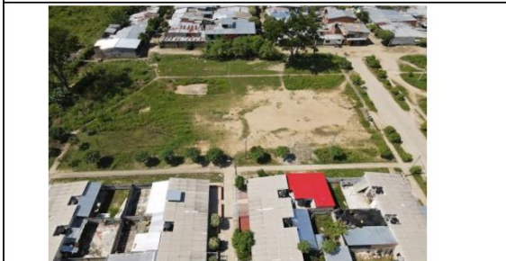
VISTAS AEREAS GENERALES DEL LOTE PROPUESTO.