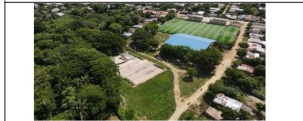
VISTA AÉREA GENERAL DEL PREDIO POSTULADO.