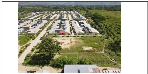
VISTAS AEREAS GENERALES DEL LOTE PROPUESTO.