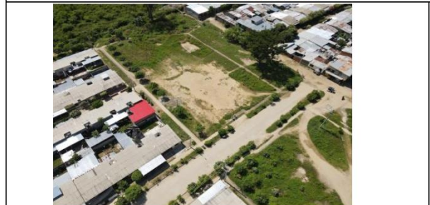
VISTAS AEREAS GENERALES DEL LOTE PROPUESTO.