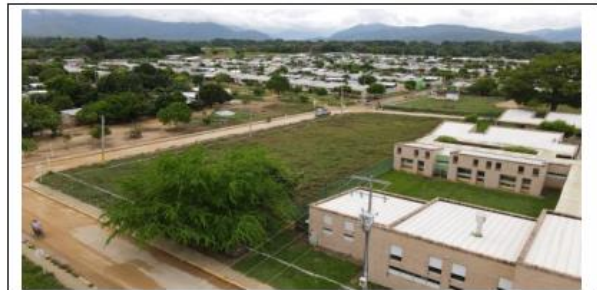
VISTAS AÉREAS GENERALES DEL LOTE PROPUESTO.