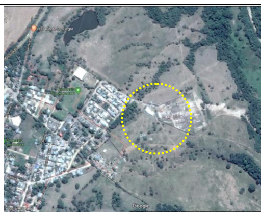
Fotografía1.Localización-Urbanización reservas de san Fernando

La ejecución de la infraestructura objeto de la presente convocatoria se llevará a cabo en el lote identificado bajo la Matrícula Inmobiliaria No. 350-242578 de la Oficina de instrumentos Públicos de Alvarado, con área total de 669.92 m2 aproximadamente,, propiedad del municipio de Alvarado. Del área total del lote disponible se intervendrá un área de 669.92 m2.