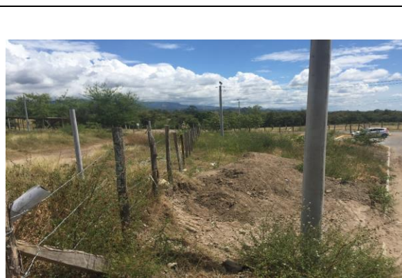
Fotografía 2. Vista del predio