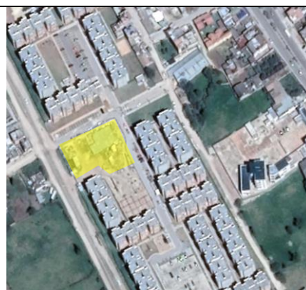
Fotografía 2. Vista general del predio

Ubicación del Lote: El lote en el cual se desarrollará el proyecto corresponde al predio con matrícula Inmobiliaria No. 074-102680 de la Oficina de instrumentos Públicos de Duitama, con área total de 3.772.35 m2 aproximadamente, propiedad del municipio de Duitama.