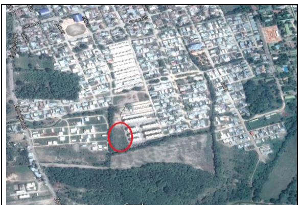
Fotografía 1. Localización proyecto-Urbanización Luis Carlos Galán Sarmiento.

La ejecución de la infraestructura objeto de la presente convocatoria se llevará a cabo en el lote identificado bajo la Matricula Inmobiliaria No. 357-62027 de la Oficina de instrumentos Públicos de Espinal, con área total de 12.263.93 m 2 aproximadamente, propiedad del municipio de Espinal. Del área total del lote disponible se intervendrá un área de 2.265 m 2 .