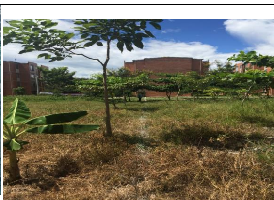
Fotografía 2. Vista del predio-Oriente del Lote al lado de la Urb. Luis Carlos Galán

Ubicación del Lote: El lote en el cual se desarrollará el proyecto corresponde al predio con matricula Inmobiliaria No. 357-62027 de la Oficina de instrumentos Públicos de Espinal, con área total de 12.263.93 m 2 aproximadamente,