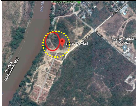
Fotografía 1. Localización proyecto.