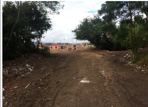
Fotografía 2. Vista general del predio urbanización Villa Diana Carolina III.

Ubicación del Lote: El lote en el cual se desarrollará el proyecto corresponde al predio con matrícula Inmobiliaria No. 307-88540 de la Oficina de instrumentos Públicos de Girardot, con área total de 10.275m 2 aproximadamente, propiedad del municipio de Ricaurte.