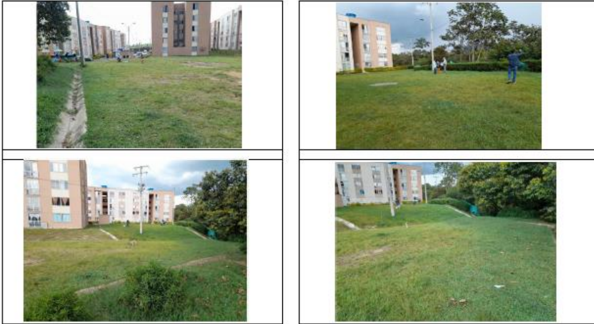
Fotografía 1. localización proyecto Urbanización Parque de las Garzas – Popayán