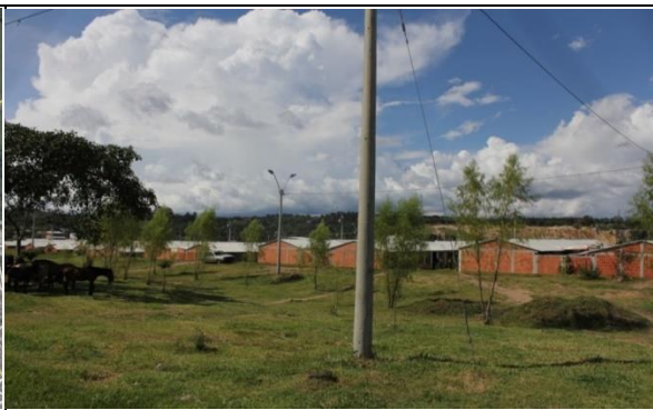
Fotografía 2. Predio donde se ejecutará el proyecto.

Ubicación del Lote: El lote en el cual se desarrollará el proyecto corresponde al predio con matrícula inmobiliaria No. 120-192676 de la Oficina de instrumentos Públicos de Popayán, con área disponible de 7.942 m 2 propiedad del municipio de Popayán y real de intervención de 3.367,00 m 2 .