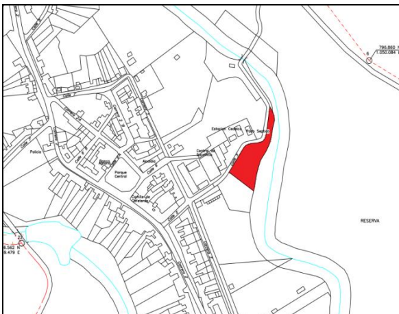
Fotografía 1. Vista aérea localización proyecto.

La ejecución de la infraestructura objeto de la presente convocatoria se llevará a cabo en el lote identificado bajo la Matrícula Inmobiliaria No. 120-222390 de la Oficina de instrumentos Públicos de Morales, con área disponible de 7.826 m 2 propiedad del municipio de Morales.