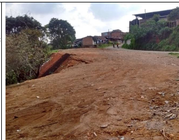
Fotografía 2. Predio donde se ejecutará el proyecto.

Ubicación del Lote: El lote en el cual se desarrollará el proyecto corresponde al predio con matrícula inmobiliaria No. 120-222390 de la Oficina de instrumentos Públicos de Popayán, con área disponible de 7.826 m 2 propiedad del municipio de