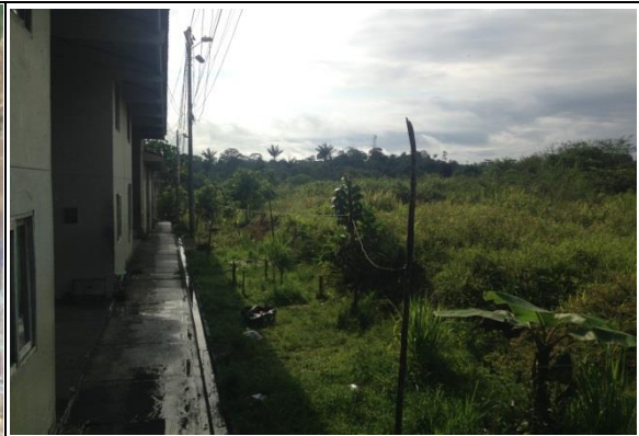
Fotografía 2. Predio donde se ejecutará el proyecto.

Ubicación del Lote: El lote en el cual se desarrollará el proyecto corresponde al predio con las matrículas inmobiliarias No. 372-55153 de la Oficina de Instrumentos Públicos de Buenaventura, con área disponible de 11432,71 m 2 propiedad del municipio de Buenaventura.