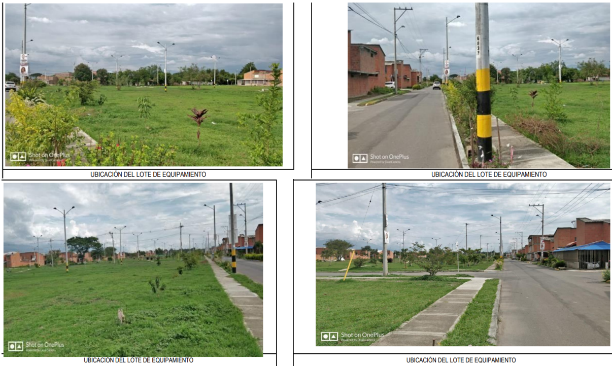
Fotografía 1. localización proyecto.