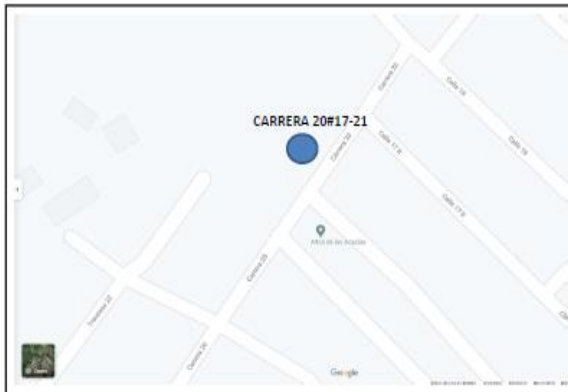
UBICACIÓN DEL LOTE DE EQUIPAMIENTO