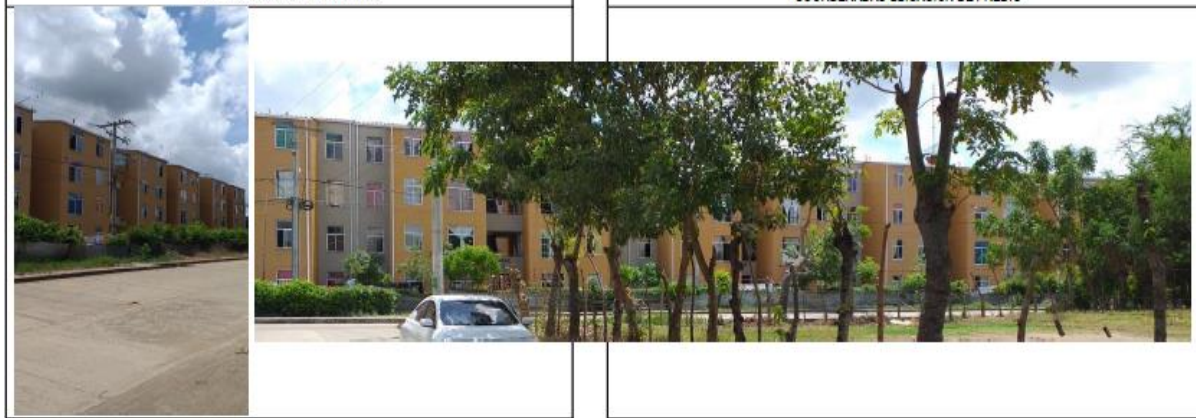
Fotografía 1. localización proyecto