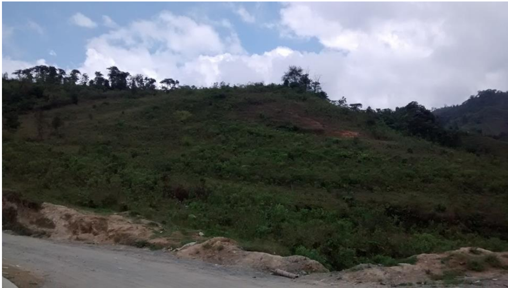
Figura 3 Localización de la zona de acceso al colegio