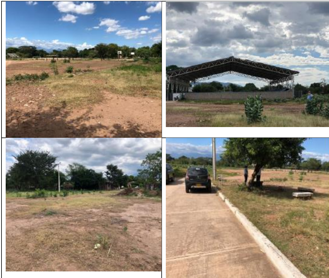
Fotografías. localización proyecto Urbanización San Felipe – San Diego