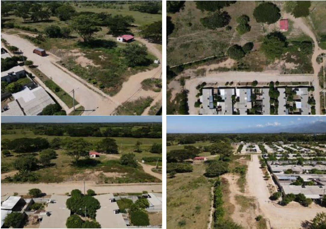
Fotografías. localización proyecto Urbanización los Manguitos – Becerril