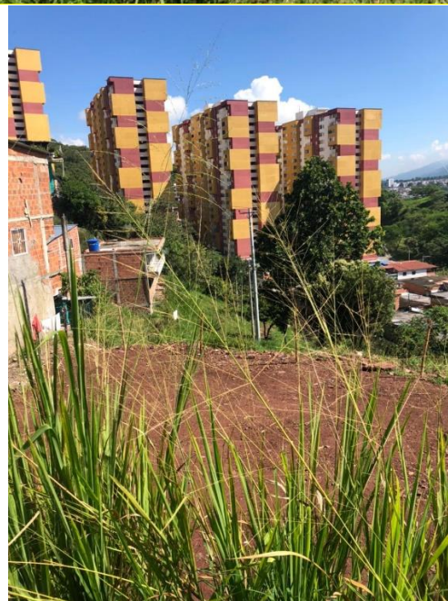
Fotografías. localización proyecto Urbanización Parque Zafiro – Piedecuesta Santander.