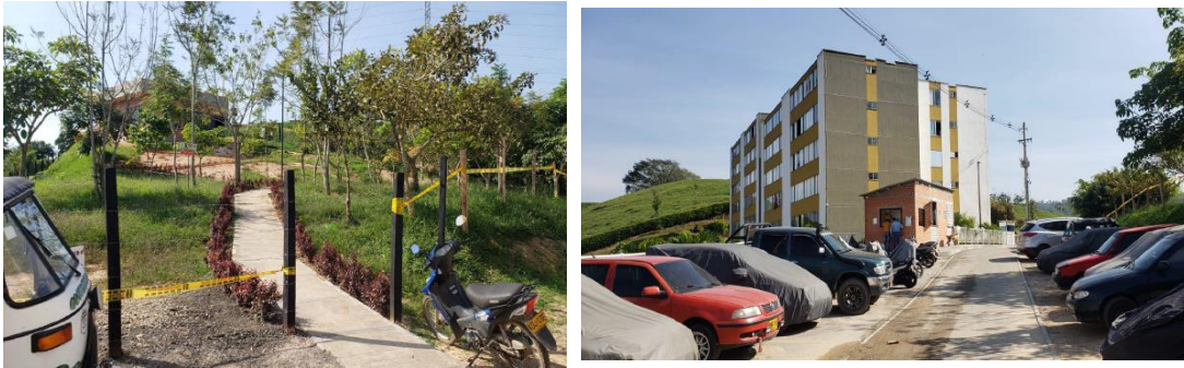
Fotografías. localización proyecto ciudadela Jorge Ríos Cortes – Lebrija Santander.