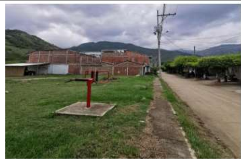
VISTA GENERAL COSTADO NORTE DEL PREDIO POSTULADO