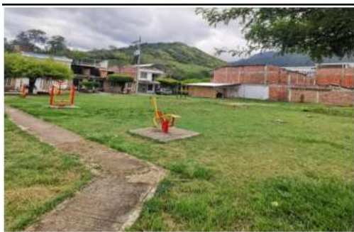
VISTA GENERAL AL INTERIOR DEL PREDIO