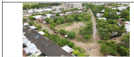
ESTADO Y CONDICIÓN GENERAL INTERIOR DEL PREDIO