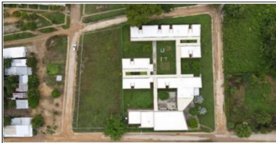
UBICACIÓN DEL LOTE DE EQUIPAMIENTO