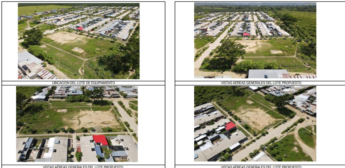
UBICACION DEL LOTE DE EQUIPAMIENTO