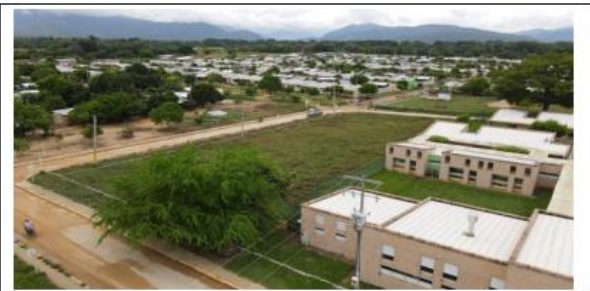
VISTAS AÉREAS GENERALES DEL LOTE PROPUESTO.