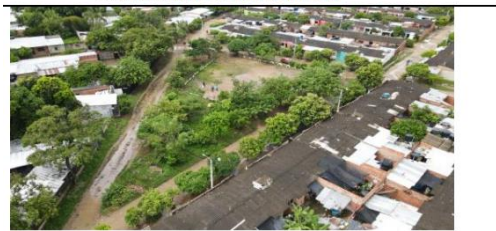
DEPOSITO DE ESCOMBROS Y BASURAS EN EL PREDIO