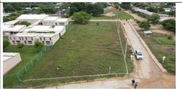
VISTAS AÉREAS GENERALES DEL LOTE PROPUESTO.