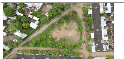
ESTADO Y CONDICIÓN GENERAL DEL PREDIO POSTULADO