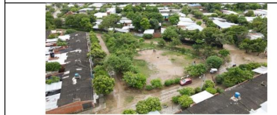
VÍA TERCERIA QUE COLINDA CON LINDERO DEL PREDIO.