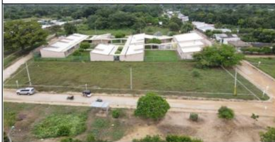
VISTAS AÉREAS GENERALES DEL LOTE PROPUESTO.