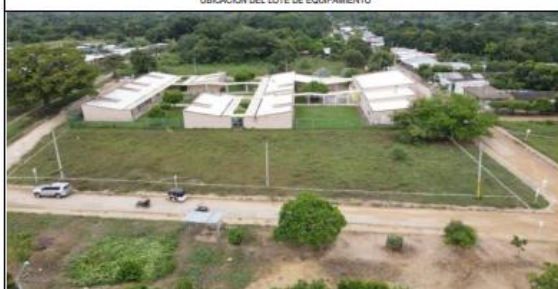
VISTAS AÉREAS GENERALES DEL LOTE PROPUESTO.