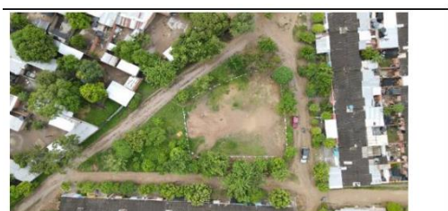
ESTADO Y CONDICIÓN GENERAL DEL PREDIO POSTULADO