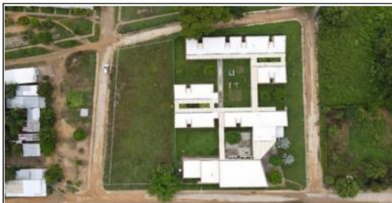
UBICACIÓN DEL LOTE DE EQUIPAMIENTO