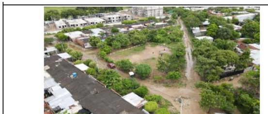
ESTADO Y CONDICIÓN GENERAL INTERIOR DEL PREDIO