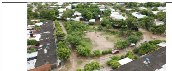
VÍA TERCIARIA QUE COLINDA CON LINDERO DEL PREDIO.