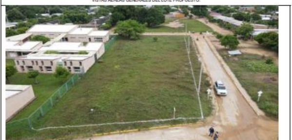
VISTAS AÉREAS GENERALES DEL LOTE PROPUESTO.