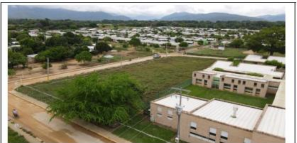
VISTAS AÉREAS GENERALES DEL LOTE PROPUESTO.