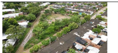
DEPOSITO DE ESCOMBROS Y BASURAS EN EL PREDIO